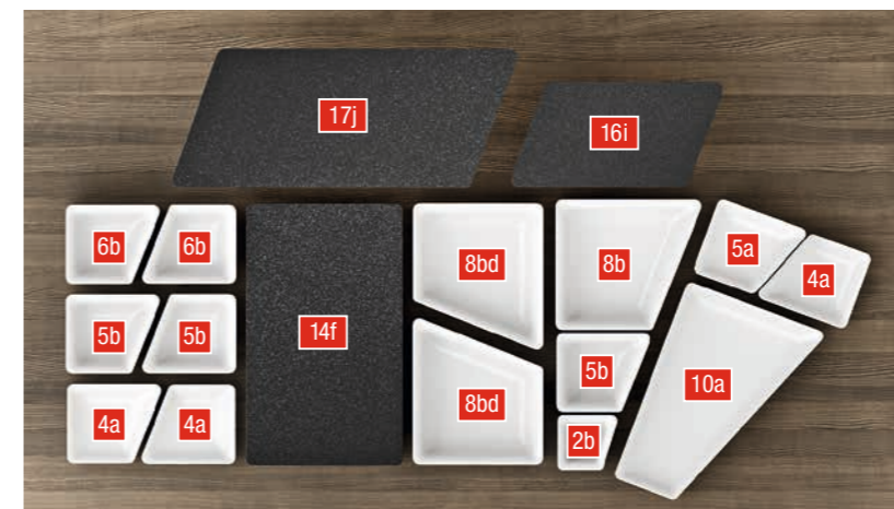
Produktübersicht auf den Seiten 12-14

Eiswanne in verschiedenen Größen, Kühlmöglichkeit mittels Crushed Ice oder Kühlakkus.