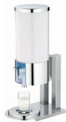
57.0119.6040 Milchdispenser ARTE