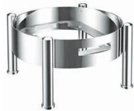
57.0007.6040 Buffetgestell IND. PLUS EXCELLENT, rund