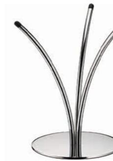
57.0037.6040 Buffetständer ,L' - FLEUR