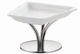
Buffetständer ,S' kann mit Porzellanschale S 35 von SEQUENCE kombiniert werden