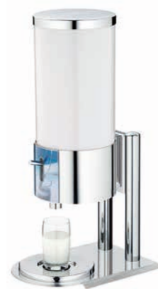
57.0118.6040 Milchdispenser EXCELLENT