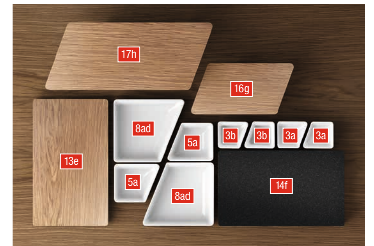
Produktübersicht auf den Seiten 12-14

Der Vielzahl an Präsentationsmöglichkeiten für Ihre Speisenplatzierung sind keine Grenzen gesetzt. Weder kreativ, noch kulinarisch. Dank intelligent aufeinander abgestimmter Teile nutzen Sie mit SEQUENCE selbst den kleinsten Raum auf dem Buffet hervorragend aus. Hoch und tief, groß und klein – diese Buffetkollektion lässt sich stilvoll kombinieren und setzt je nach Bedarf individuelle Highlights, die Ihre Gäste begeistern. Und falls Sie einen zusätzlichen Blickfang wünschen, ist die modulare Kollektion beliebig ausbau- und erweiterbar. Perfekt!