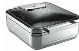
57.0021.6040 CD INDUCTION PLUS ARTE GN 2/3