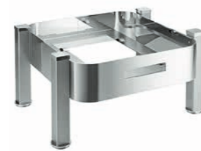
57.0013.6040 Buffetgestell IND. PLUS ARTE, GN 2/3