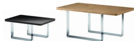
Podeste aus Holz oder Corian in zwei Größen zur Präsentation Ihrer Speisen und Waren.

Das Buffet-Konzept SEQUENCE ist mehr als nur das Zusammenspiel seiner rund 40 Teile. Die Kollektion besticht durch ihre außergewöhnlichen Details, die unschlagbare Modularität und die anmutenden Materialien. Mit SEQUENCE ist Ihnen die elegante und besondere Speisenpräsentation sicher. Egal ob Frühstück-, Mittags-, TeaTime- oder Abendbuffet – SEQUENCE setzt wunderschöne Akzente und ist der perfekte Begleiter für Ihren Gastronomie-Alltag. Innovativ, flexibel, einzigartig.