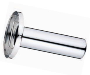
57.0120.6040 Eisröhre zu Saft-/Milchdispenser

Weitere Artikel für das Buffet finden Sie im HEPP Gesamtkatalog und HEPP Onlinekatalog auf www.hepp.de