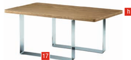
Podestfüße S, Edelstahl 18/10 190 x 40 x 150 mm, 57.0156.9990