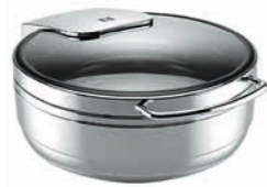
57.0001.6040 CD INDUCTION PLUS EXCELLENT, rund