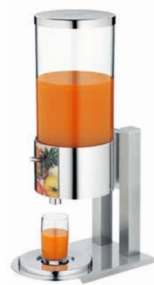
57.0117.6040 Saftdispenser ARTE