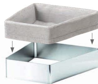
Brotkorb mit Stoffeinsatz in drei Größen L, M und S zum Einhängen in entsprechenden Rahmen Höhe 70 oder 100 mm.

Die Verführung am Buffet ... SEQUENCE schmeichelt dem Auge und bringt den Gaumen auf den Geschmack. Das intelligente Buffet-Konzept mit außergewöhnlicher Formgebung und flexibler Handhabung setzt ganz neue Maßstäbe in der Speisenpräsentation. Eine völlig neuartige Zusammensetzung von trapezförmigen Modulen sorgt für schwungvolle Lebendigkeit in Ihren Gasträumen. Selbstverständlich sind alle Einzelteile aufeinander abgestimmt und erleichtern Ihrem Personal den Aufbau sowie die Kombinationsfreiheit. SEQUENCE macht Ihr Buffet und Bankett zu einem echten Erlebnis!