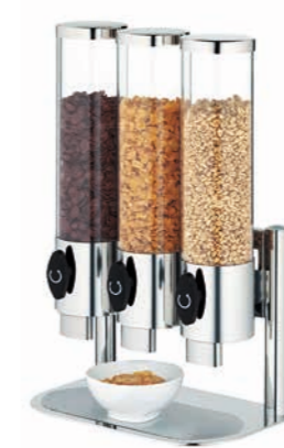
57.0123.6040 Cerealendispenser EXCELLENT Reihenlösung