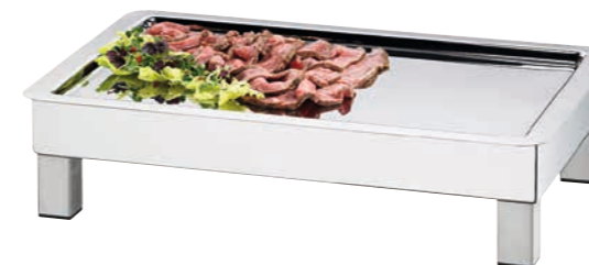
57.0065.6040 Plattenständer tief Anwendungsbeispiel