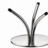
57.0035.6040 Buffetständer ,S' - FLEUR