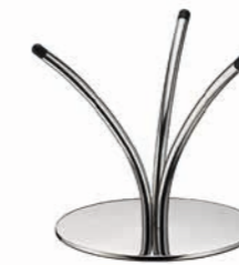
57.0036.6040 Buffetständer ,M' - FLEUR