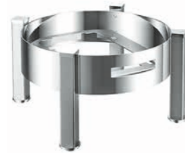
57.0008.6040 Buffetgestell IND. PLUS ARTE, rund