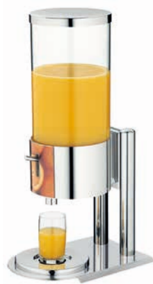
57.0116.6040 Saftdispenser EXCELLENT