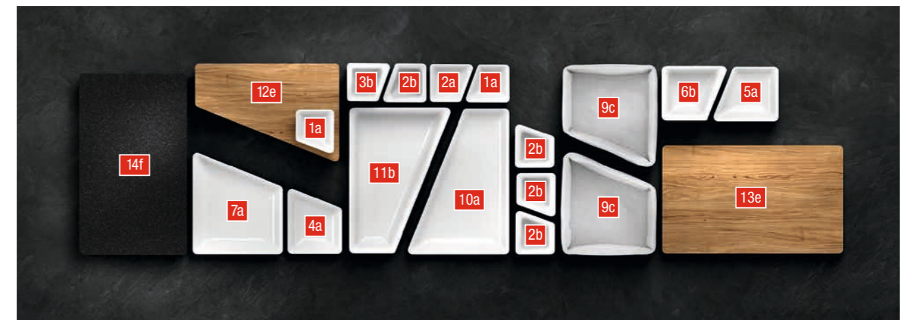
Produktübersicht auf den Seiten 12-14