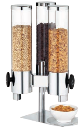
57.0122.6040 Cerealendispenser EXCELLENT drehbar