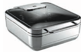
57.0002.6040 CD INDUCTION PLUS EXCELLENT GN 2/3