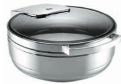
57.0020.6040 CD INDUCTION PLUS ARTE, rund