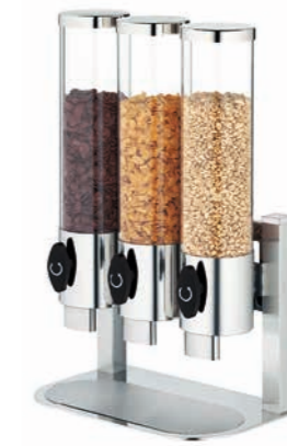
57.0124.6040 Cerealendispenser ARTE Reihenlösung