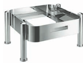
57.0012.6040 Buffetgestell IND. PLUS EXCELLENT, GN 2/3