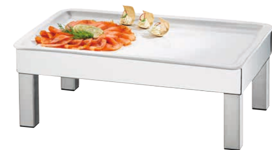
57.0066.6040 Plattenständer hoch Anwendungsbeispiel